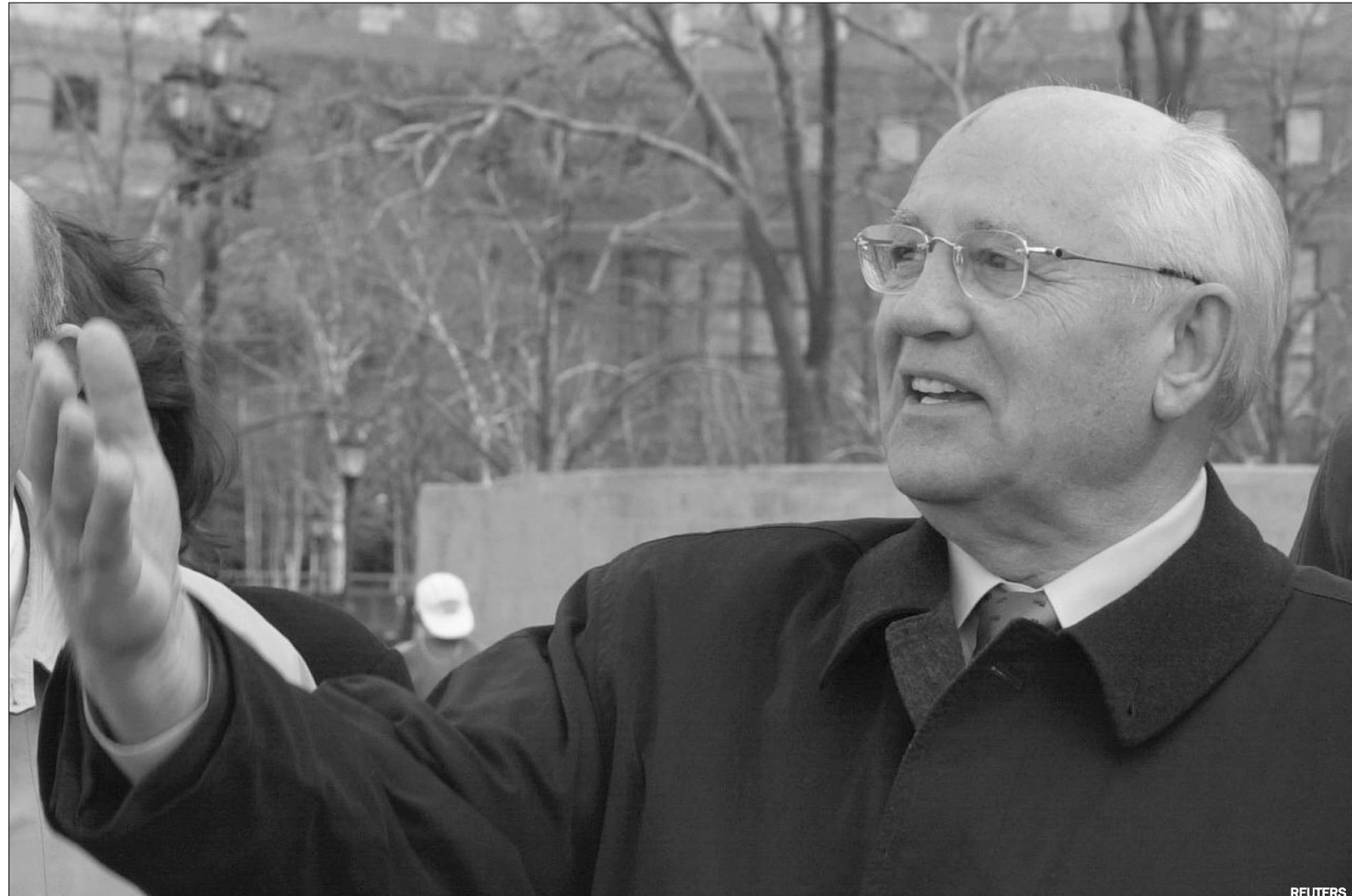
Михаил Горбачев во время своего предыдущего визита в США (март 2002 года) посетил место, где раньше высились две башни Всемирного торгового центра в Нью-Йорке.

"Вот вы говорите, что король - это фигура слабая и зависит от окружения. Но когда речь идет о вешах глобальных, речь не о слабости или силе. Речь о жизни, - начал Горби. - В то время речь шла не о том, кто победит в ядерной войне, а о том,