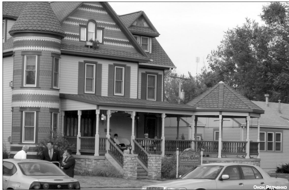
Тот самый "пряничный домик", в котором Горбачев остановился в Линдсборге в октябре 2005 года.

"Это была не приватизация, а приватизация, - утверждает Горби. - Как можно было перевести в частную собственность нефтяные компании? Абрамович приобрел "Сибнефть" у Ельцина за 180 млн. долларов. Я уверен, что реальная стоимость этой компании была больше. Сейчас ее собираются продать за 13 миллиардов. На это стоит обратить внимание. В